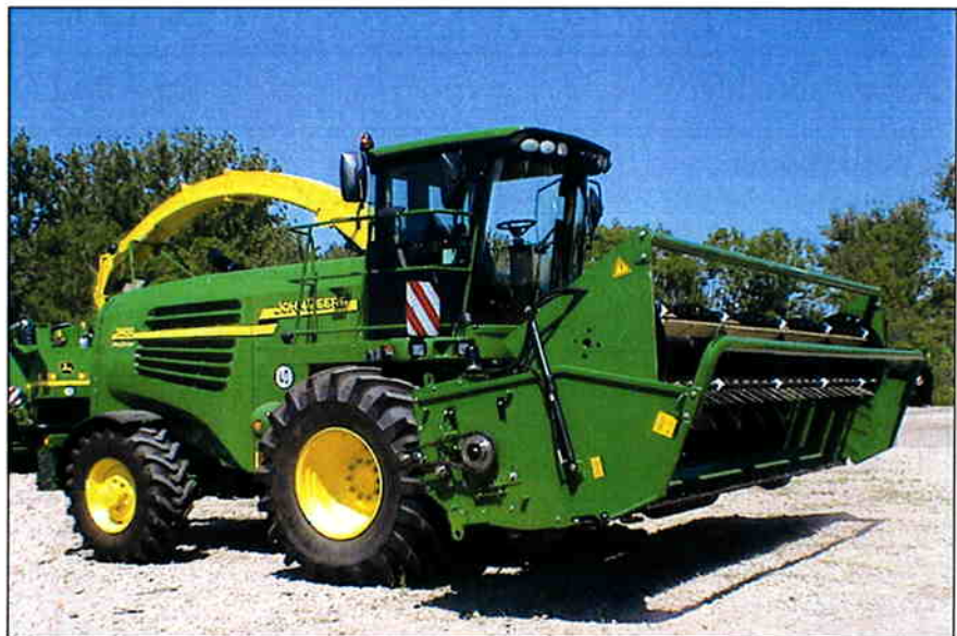
Champion skærebord 5,1 m. Busatis Bidux til John Deere.

Fremkørselshastigheden er ca. 8-14 km/time, og alt afhængig af afgrødens beskaffenhed, kan omdrejningstallet på skærebordet ændres, ved at ændre hastigheden på basismaskinens PTO aksel.