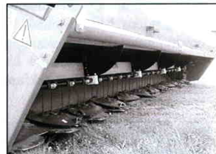
4,9m skivebord, standard med fast vinde og mekanisk træk på vinde og snegl.

Skivebjælke transmission: Flere muligheder, SPØRG