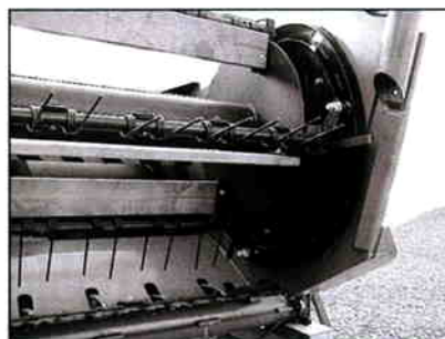
Lukket kulisse- styr med bred- bane lejer.