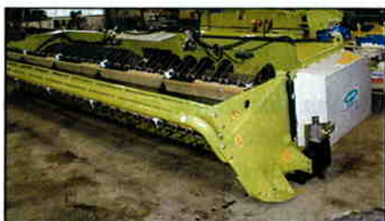
Champion skærebord 6.1 m. Busatis Bidux hydraulisk til Claas Serie 8/9. Reel hydraulisk op og ned (ekstraudstyr).

Her afklippes afgrøden. Vinde og snegl transporterer afgrøden op til udløbet. Basismaskinens indføring sørger for den videre trans-