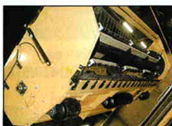
Champion skærebord Busatis Bidux til New Holland FX.