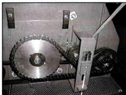
Mekanisk kniv- og snegltræk for BB420/510 standard

60 L/min til vinde og kniv- træk BB610(Option)