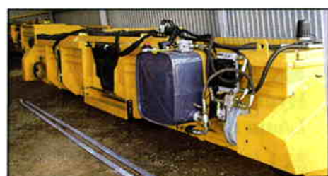
Champion skærebord 6,1m Busatis Bidux med Hydraulisk Power Pack 60L/mm