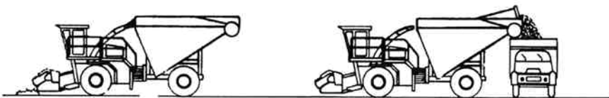
Fast monteret container op til 30 m 3 .