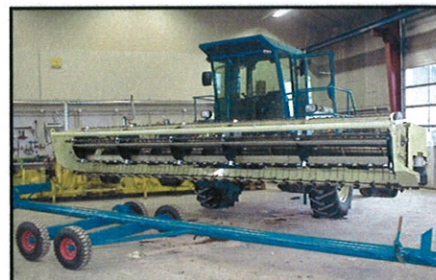
Champion skårlægger med 20 fods/6,1m skærebord.