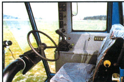
Fra førerkabinen er der en god oversigt over skærebordet og instrumenterne.