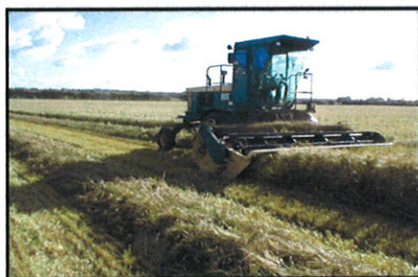
CHAMPION skårlægger i drift med centerudlægning.

Skærebordet er udstyret med nogle brede ruller, som sammen med de hydrauliske akkumulatore, får det til at følge terrænet meget nøje. Skæresystemet kan efter ønske være dobbeltskærende hydraulisk drevne knive, (BUSATIS system), eller hydraulisk drevet kniv og fingersystem.