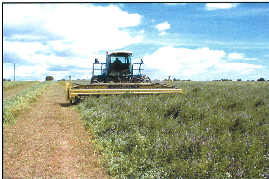
CHAMPION skårlægger med Champion skærebord i drift i England.

Samtlige funktioner kan overvåges fra den centralt placerede luxus førerkabine, hvorfra der er et godt